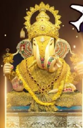
องค์ดึกขลุ่ยพิเศษ