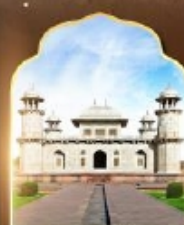
ถ้ำมาฮาสน้อย