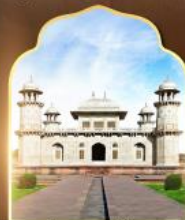
ถ้ำมาฮานอย