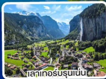
ทะเลเทอร์รูพเพิน