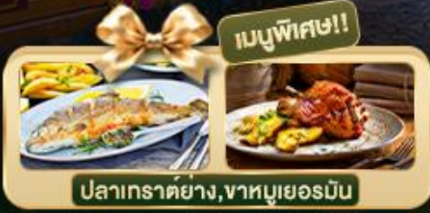
เมนูพิเศษ!! ปลาทราย่าง, ขาหมูเยอรมัน

Germany Austria Czech Slovenia Hungary Celebrate Christmas Market Zugspitze Munich Salzburg Hallstatt Bratislava