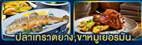
ปลาเทราต์ย่าง, ฆาตมูเยอร์มิน