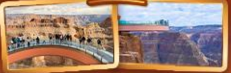
ชมความยิ่งใหญ่ของ GRAND CANYON WEST SKYWALK