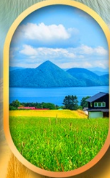
ทะเลสาบโทยา