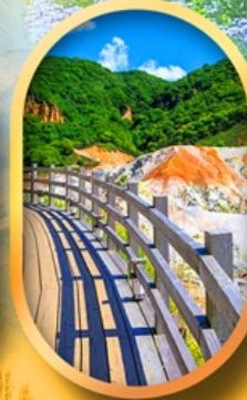
โนโบริเบ็ตสึ