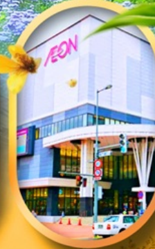
อโชนมอลล์