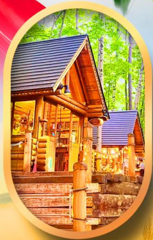
นิงเกิลเทอเรส