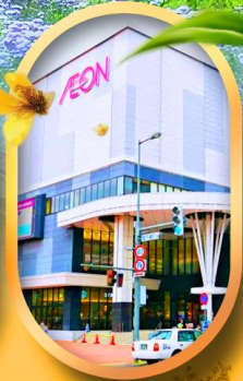
อ็อนมอลล์