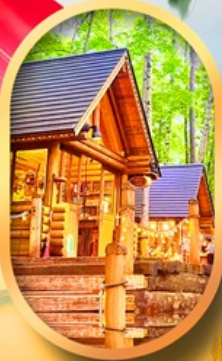
นิงเกียวทามะออนเซ็น