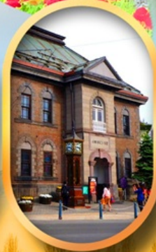
พิพิธภัณฑ์กล่องดนตรี