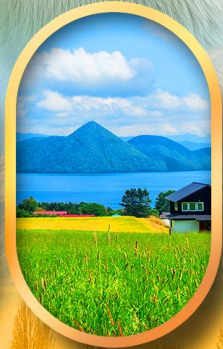
ทะเลสาบโทยะ