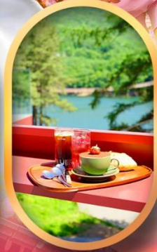
คาเฟ่ลับกลางป่า