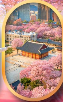
พระราชวังชางด็อกกุง