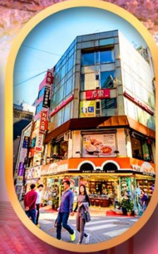
ช้อปปิ้งย่านเมียงดง