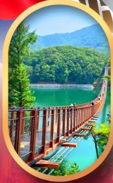
สะพานแขวนมาจิง