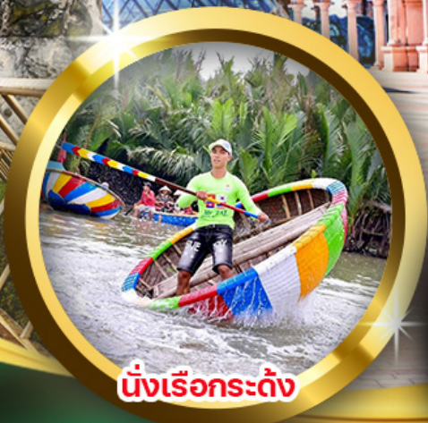
บึงเรือกระดิ่ง