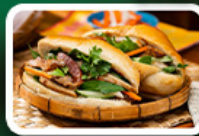
“บั้นหมี่”