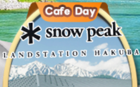
Snow Peak Land Hakuba