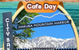
The City Bakery