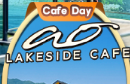
Ao Lakeside Cafe