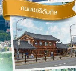
ถนนแอร็ดันกิล