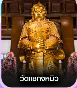
วัดแอกหงอ