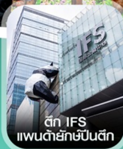
ตึก IFS แพนด้ายักษ์ปิ่นตึก