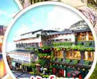
หมู่บ้านโบราณ จ้าวเฟิน