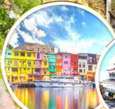
ท่าเรือสายรุ้ง