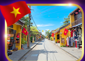
เมืองท่ามรดกโลก ฮอยอัน