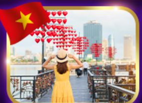
เช็กอินสะพานแห่งความรัก