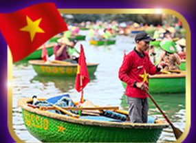
เรือกระด้ง หมู่บ้านกิมถาน