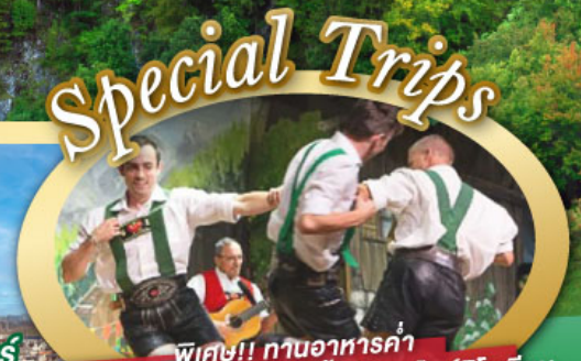
พิเศษ!! ทานอาหารค่ำ พร้อมชมการแสดงดนตรีพื้นเมืองสโตร์ไทโรเลียน และเยือนเมืองอูเทรคต์ สีสันใหม่เบียร์แลนด์

ไฮไลท์ในโปรแกรม • เยือนเมืองแห่งแคว้นบาวาเรีย และ ทิโรล • สนุกสนานเหมืองเกลือเบียร์เทสกาเดิน • เข้าชมปราสาทออยชวานสไตน์