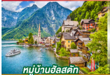
หมู่บ้านอัลสติก