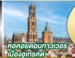
หอคอยคอมทาวเวอร์ เมืองอูเทรคต์