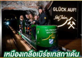
เหมืองเกลือเบียร์เทสกาเดิน