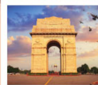
♡♡♡ India Gate