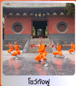
โชว์กังฟู