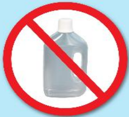
ขวดน้ำยา