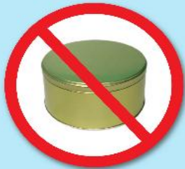
กล่องโลหะ