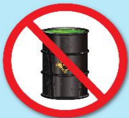
สารกัมมันตรังสี