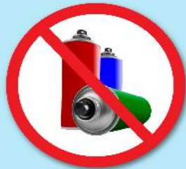
ขวดสเปรย์