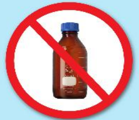
ขวดสารเคมี