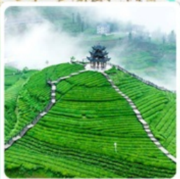
ไร่ชาอู่เจียโก