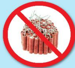
พลุ, ประทัด