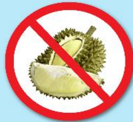
ผลไม้เขตร้อน ที่มีหนาม