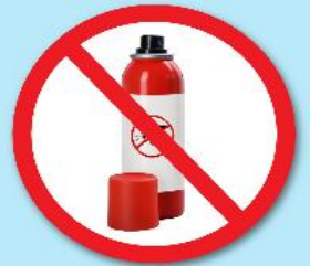
ขวดน้ำยา ฆ่าแมลง