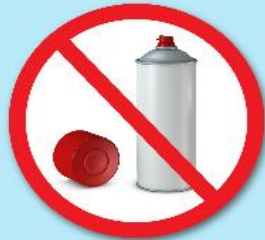
กระป๋องสเปรย์