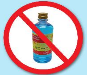
ขวดแอลกอฮอล์