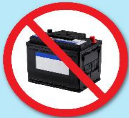
แบตเตอรี่ดำ