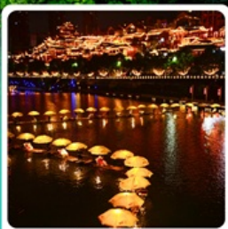
เมืองเซียนเิน