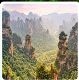
เขาหวตาร