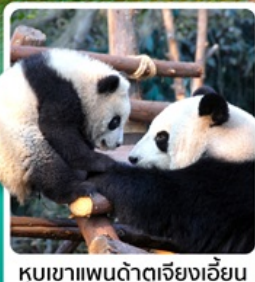
หุบเขาแพนด้าตู่เจียงเอี่ยน