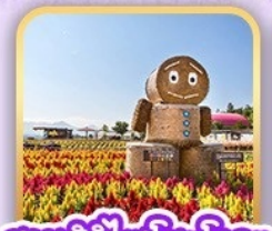
สวนซึกิไซโนะโอกะ