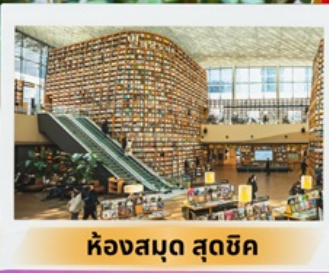
ห้องสมุด สุดชิค