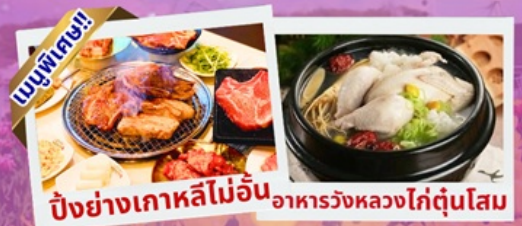
ปิ้งย่างเกาหลีไม่อั้น อาหารวังหลวงไก่ตุ๋นโสม

เขคอินเกาะนามิ สุดโรแมนติก ชมศิลปะดิจิทัลสุดล้ำ บนจอ LED เสมือนจริงขนาดยักษ์ สนุกสุดมันส์ สวนสนุกล็อตเต้เวิลด์ ชมต้นจูนีเปอร์จีนอายุกว่า 1,000 ปี และดอกไม้ตามฤดูกาล อิสระช้อปปิ้ง เมียงดง ช้อปปิ้งปลอดภาษี Lotte Duty Free