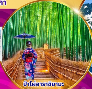
ป่าไฟ้อาราชิมะ

พิเศษ! แอ้อบเซ็น นั่งเคเบิลคาร์ ชมวิวภูเขาแอลป์