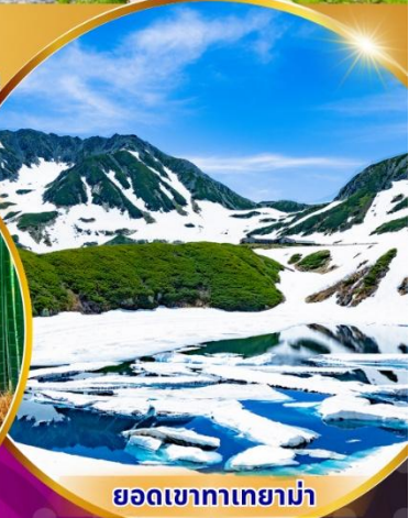
ยอดเขาทาเทยาม่า