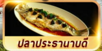
ปลาประรานาบดี