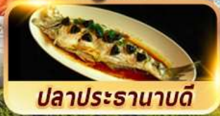
ปลาประรานาบดี