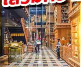
ร้านไอศกรีมมียาฮาร่า