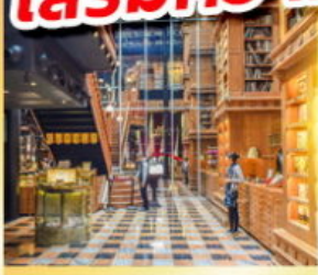
ร้านไอศกรีมมียาฮาร่า