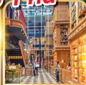
ร้านไอศกรีมมियाฮาร่า