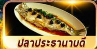
ปลาประรานาบดี