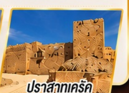
ปราสาทแคร็ค