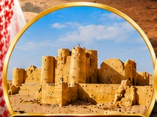
กลุ่มปราสาททะเลทราย (Desert Castles)