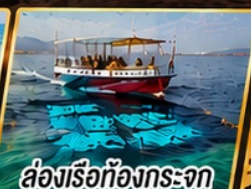
ล่องเรือท้องกระจก