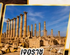
เจอร์ราช