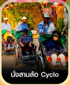
นั่งสามล้อ Cyclo