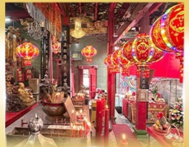
ศาลเจ้ากวนอู คลองสาน