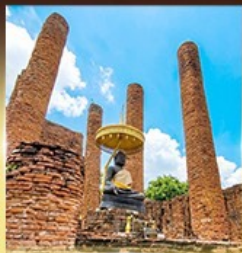
วัดธรรมิกราช