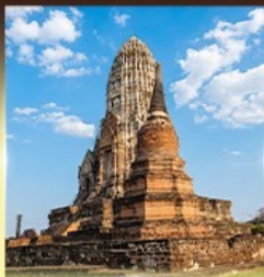
วัดราชบูรณะ