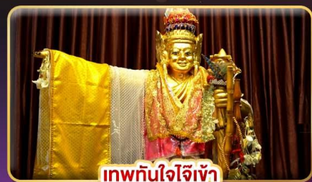
เทพทันใจโจ้เข้า