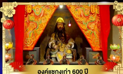
องค์แขกเก่า 600 ปี