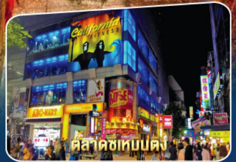
ตลาดซีเหมินตง