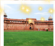
Ajmer Sharif Dargah