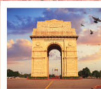
♡♡♡ India Gate