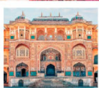
♡♡♡ Amber Fort