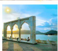
Ana Sagar Lake