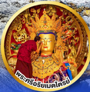
พระศรีอริยเมตไตรย์