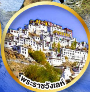
พระราชวังเลห์