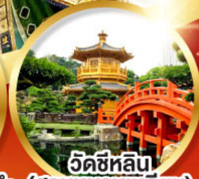
วัดซีหลิน