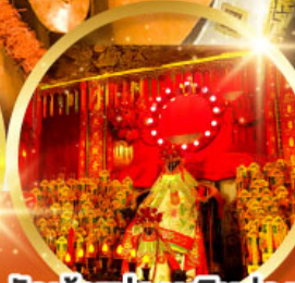
วัดเจ้าแม่กวนอิมอ่องอำ