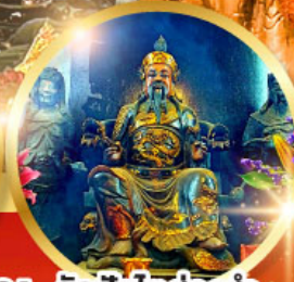
วัดปักโต้อ่องอำ