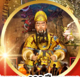
วัดเซกง 600 ปี หุ่นทอง