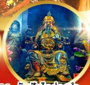
วัดปักไต้ย่องอำ

ขอพรความสำเร็จ การงาน ขอพรความสำเร็จในชีวิตการงาน