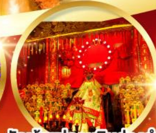
วัดเจ้าแม่กวนอิมย่องอำ