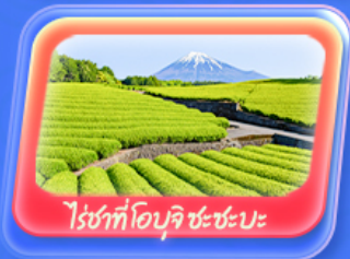
ไร่ชาที่โอบุจิ ชะชะบะ

สัมผัสความเป็นญี่ปุ่น ชมวิวฟูจิที่ ทะเลสาบยามานากะโกะ ศาลเจ้าฟูจิซังเซเนงงุ "Unseen" ขอฟรด้วยหัวโซเก้ที่ วัดมัตสึชิม่า โซเด็น ถ่ายภาพวิวไร่ชาที่ โอบุจิ ชะชะบะ ขอฟร วัดอาซากุสะ วัดพระใหญ่อุซึคุ โดบุทสึ เดินเล่น คาวาโกะเอะ Toyosu Senkyaku Banrai ซุปป์งย่านชินจูกุ และห้างไดเวอร์ซิตี