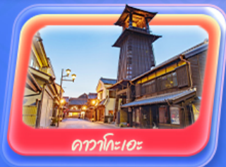
คาวาโกะเอะ