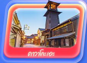
คาวาโกเอะ