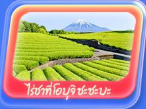
ไร่ชาที่โอบุจิ ชะชะบะ

Highlight สัมผัสความเป็นญี่ปุ่น ชมวิวฟูจิที่ ทะเลสาบยามานากะโกะ ศาลเจ้าฟูจิซังเซมเนน "Unseen" ขอบพระด้วยหวีโซเก้ทำ ที่วัดมิตสึชิมาม่า โซเดิน ถ่ายภาพวิวไร่ชาที่ โอบุจิ ชะชะบะ ขอบพระ วัดฮาซาทะกุสะ วัดพระโศภิตคุ โดบุทสึ เดินเล่น คาวาโกเอะ Toyosu Senkyaku Banrai ซุปปิ้งย่านชินจูกุ และห้างไดเวอร์ซิตี