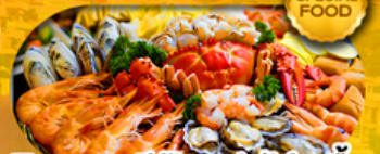
พิเศษเมนูซีฟู้ดบุฟเฟ่ต์ 11 มื้อ เดินทาง มีนาคม 2569