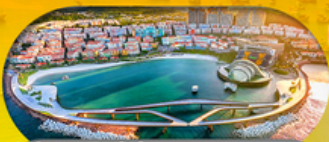
Kiss Bridge สะพานจูบ รวมค่าเข้าสะพานจูบแล้ว