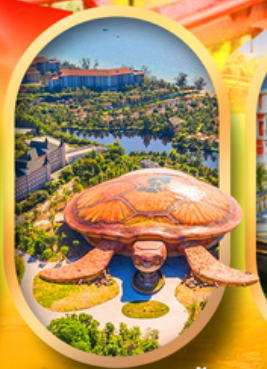
พิพิธภัณฑ์สัตว์น้ำ