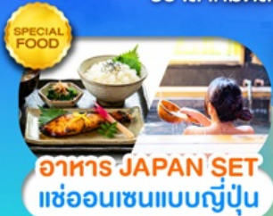
อาหาร JAPAN SET แช่ออนเซนแบบญี่ปุ่น