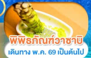
พิพิธภัณฑที่วาชานี เดินทาง พ.ศ. 69 เป็นต้นไป