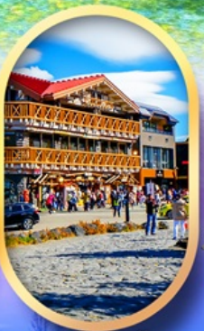
ภูเขาไฟฟูจิ ชั้น 5