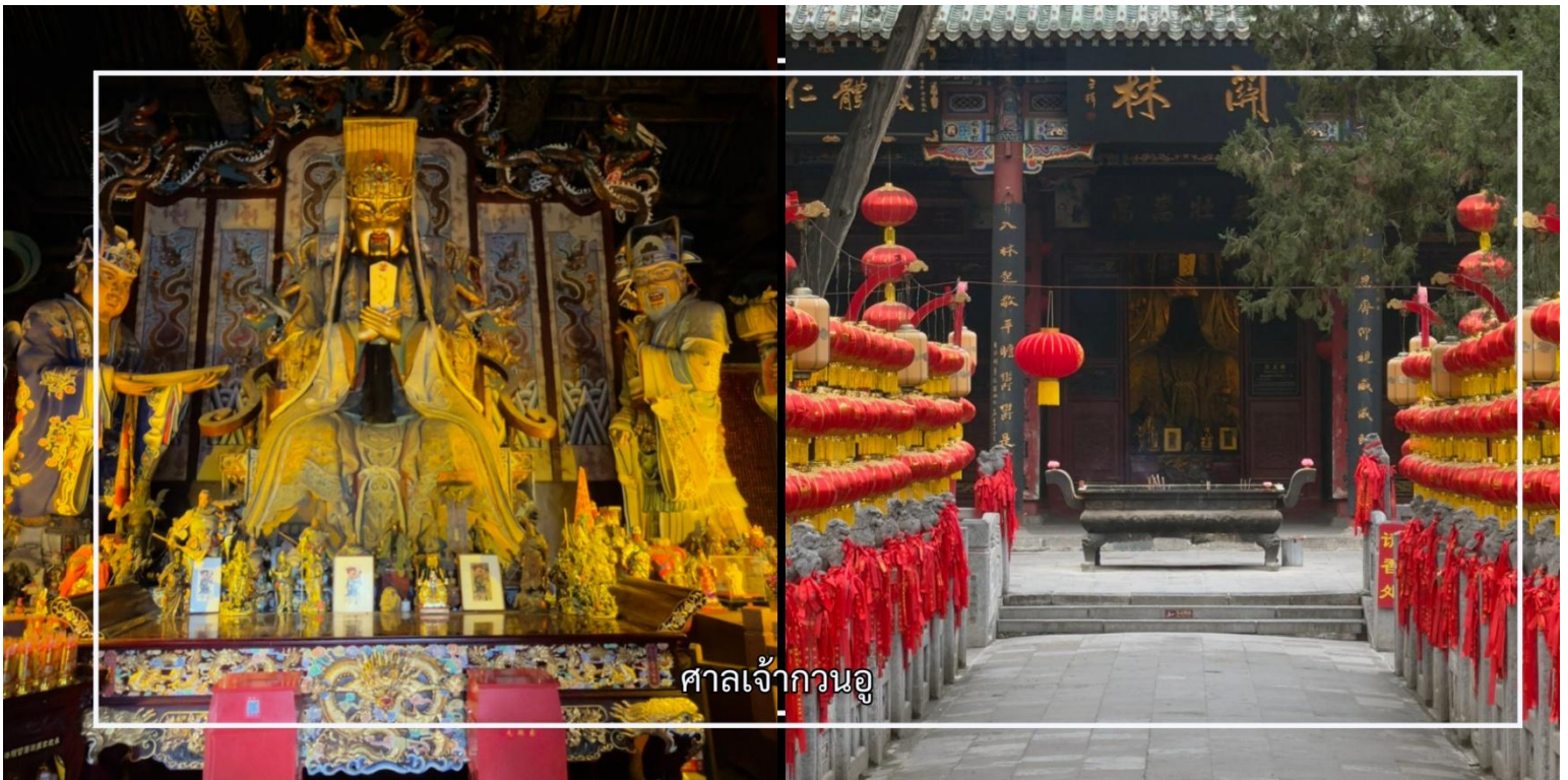
ศาลเจ้ากวนอู

จากนั้นนำท่าน สักการะ ศาลเจ้ากวนอู สถานที่ศักดิ์สิทธิ์ที่มีความเกี่ยวข้องกับ “กวนอู” วีรบุรุษผู้เป็นสัญลักษณ์แห่งความซื่อสัตย์ ความกล้าหาญ และคุณธรรมตามคติจีน ซึ่งได้รับการเคารพนับถืออย่างแพร่หลายทั้งในหมู่ชาวจีนและชาวเอเชีย ที่นี่เป็นที่ฝัง “ศิระชะ” ของกวนอู ตามตำนานในยุคสามก๊ก นอกจากนี้ ท่านจะได้สัมผัสบรรยากาศของเมืองโบราณ ชมสถาปัตยกรรมอันทรงคุณค่า เรียนรู้เรื่องราวจากยุคสามก๊ก และดื่มด่ำกับวัฒนธรรมท้องถิ่นที่ยังคงสืบทอดมาจนถึงปัจจุบัน