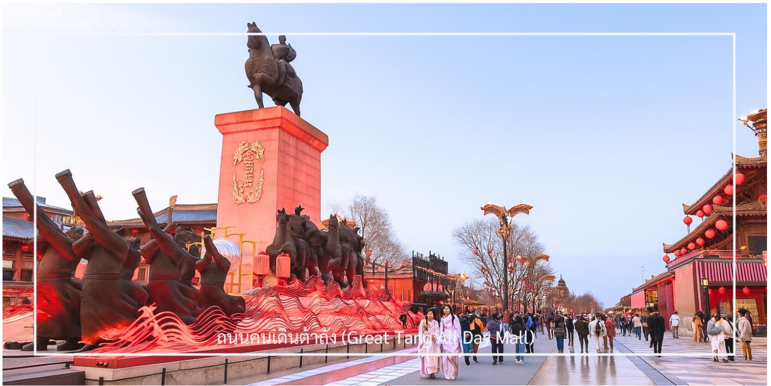
ถนนคนเดินต้าถิง (Great Tang All Day Mall)