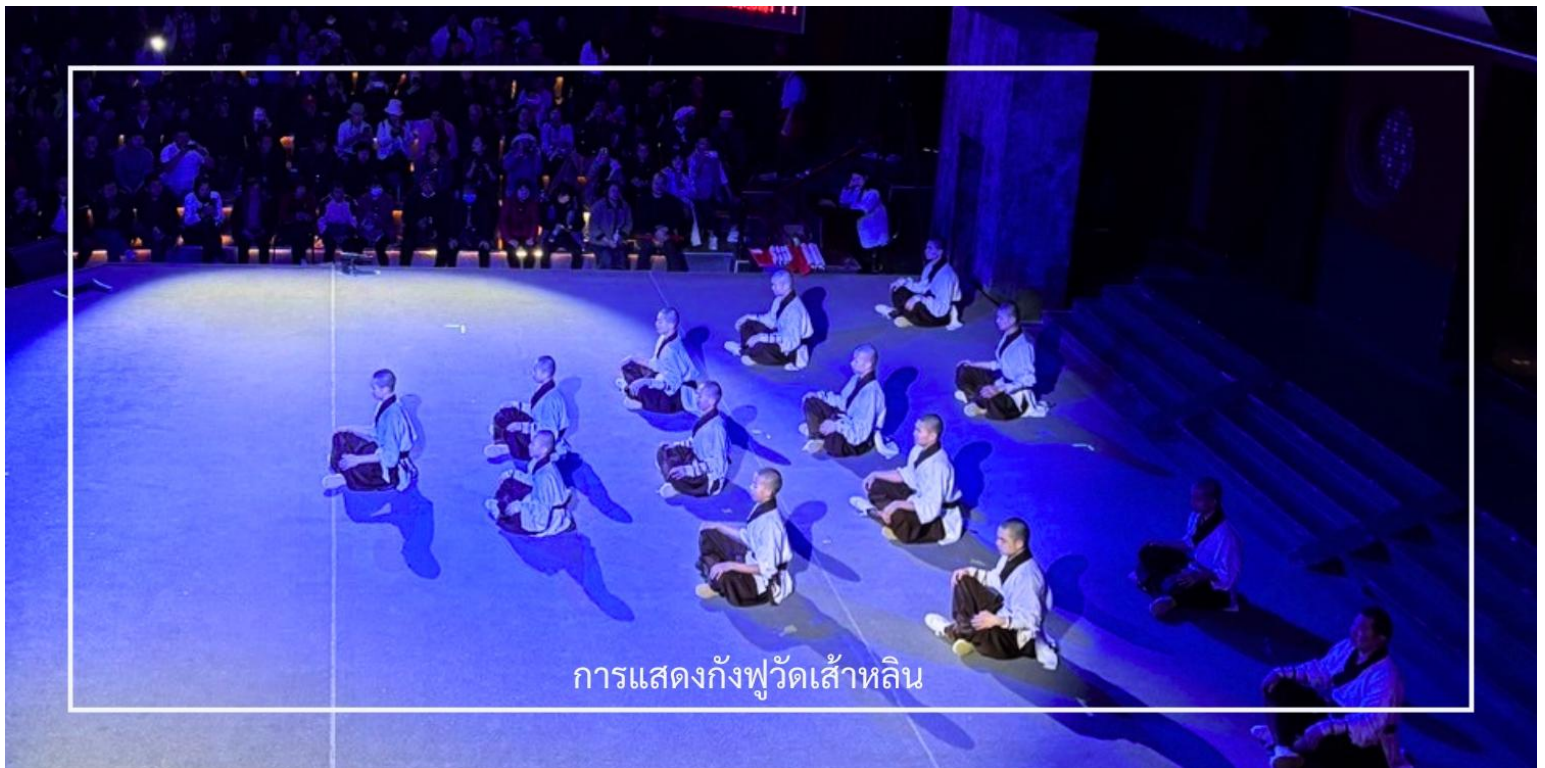
การแสดงกังฟูวัดเส้าหลิน

ไม่พลาด! กับประสบการณ์สุดพิเศษ ชมการแสดงกังฟูวัดเส้าหลิน ศิลปะการป้องกันตัวระดับตำนานที่เลื่องชื่อไปทั่วโลก การแสดงถ่ายทอดความแม่นยำ รวดเร็ว และแข็งแกร่งของวิทยายุทธเส้าหลิน ผ่านกระบวนท่าที่ได้รับแรงบันดาลใจจาก สัตว์นานาชนิด เช่น เสือ งู กระเรียน ผสานเข้ากับการตีลังกา หมุนตัว และการควบคุมร่างกายอันน่าทึ่ง ด้วยแสง สี เสียง และดนตรีประกอบฉากที่จัดเต็ม ทำให้โชว์นี้เต็มไปด้วยพลังและความเร้าใจ นอกจากนี้ ผู้ชมยังมีโอกาสได้มีส่วนร่วมบนเวที เพิ่มความสนุกสนาน และประทับใจไม่รู้ลืม