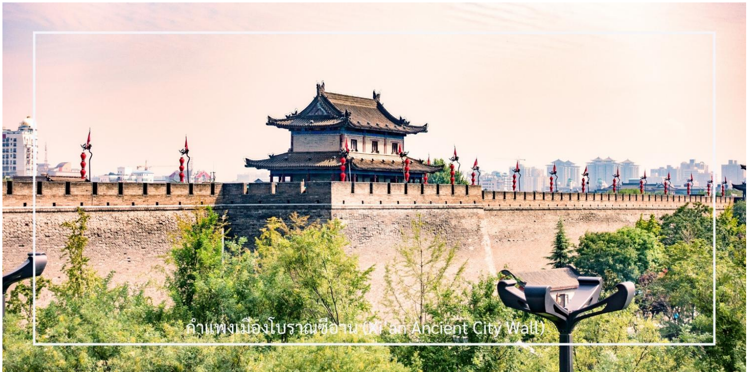
กำแพงเมืองโบราณซีอาน (Xi'an Ancient City Wall)

นำท่านชื่นชม กำแพงเมืองโบราณซีอาน (Xi'an Ancient City Wall) อีกหนึ่งกำแพงเมืองโบราณเก่าแก่และสมบูรณ์ที่สุดของจีน สร้างขึ้นในสมัยราชวงศ์หมิงเมื่อกว่า 600 ปีก่อน มีความยาวโดยรอบประมาณ 13.7 กิโลเมตร กว้าง 12-14 เมตร และสูงราว 12 เมตร ออกแบบอย่างแข็งแกร่งเพื่อการป้องกันเมือง โดยมีป้อม ประตูเมือง และคูน้ำล้อมรอบ ปัจจุบันกลายเป็นแหล่งท่องเที่ยวยอดนิยม นักท่องเที่ยวสามารถเดินเล่นหรือปั่นจักรยานบนกำแพง เพื่อชมทัศนียภาพของเมืองซีอานทั้งภายในและภายนอกเขตกำแพงได้อย่างชัดเจน