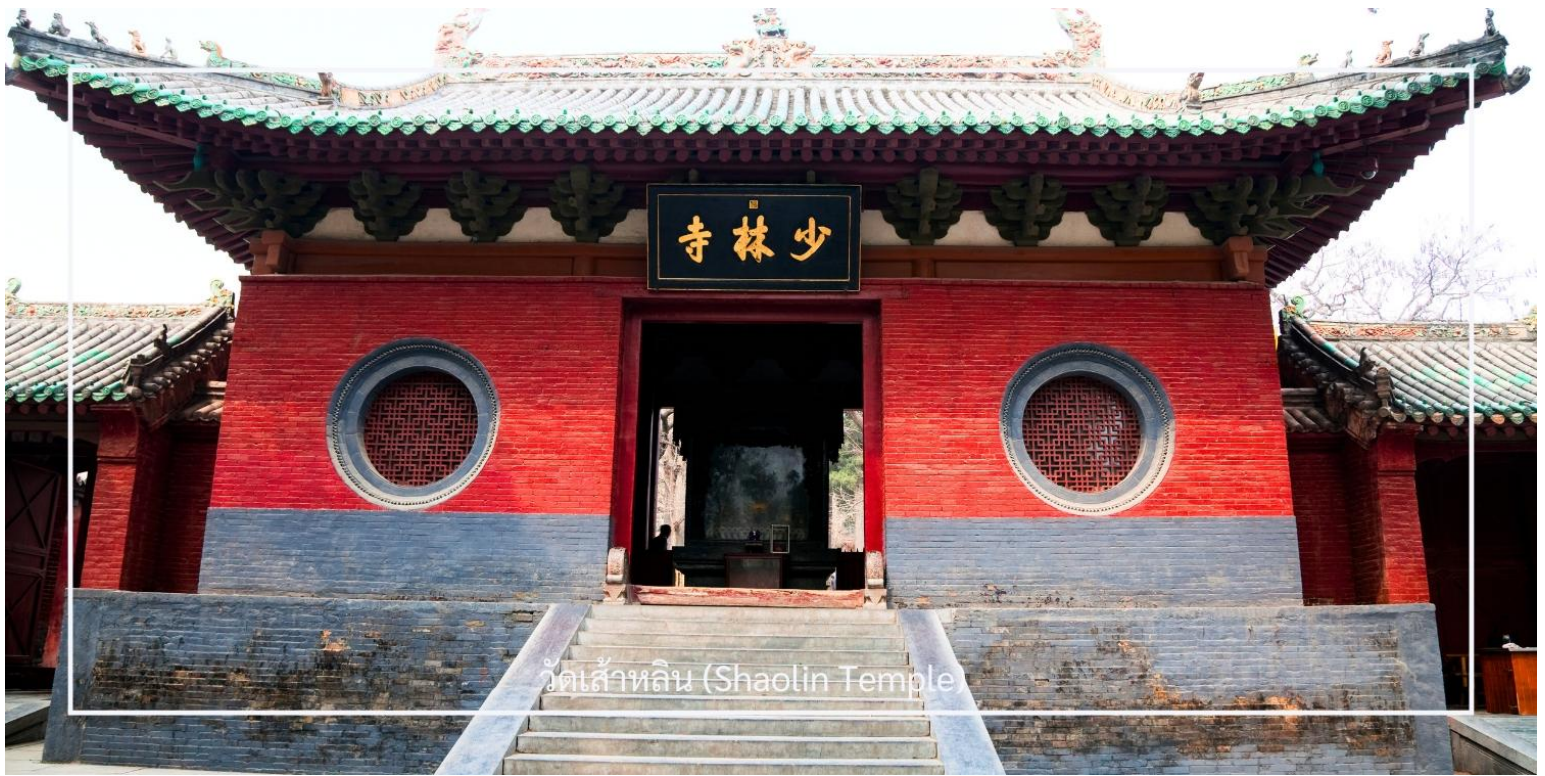
วัดเส้าหลิน (Shaolin Temple)

ไม่พลาด! กับประสบการณ์สุดพิเศษ ชมการแสดงกังฟูวัดเส้าหลิน ศิลปะการป้องกันตัวระดับตำนานที่เลื่องชื่อไปทั่วโลก การแสดงถ่ายทอดความแม่นยำ รวดเร็ว และแข็งแกร่งของวิทยายุทธเส้าหลิน ผ่านกระบวนท่าที่ได้รับแรงบันดาลใจจาก สัตว์นานาชนิด เช่น เสือ งู กระเรียน ผสานเข้ากับการตีลังกา หมุนตัว และการควบคุมร่างกายอันน่าทึ่ง ด้วยแสง สี เสียง และดนตรีประกอบฉากที่จัดเต็ม ทำให้โชว์นี้เต็มไปด้วยพลังและความเร้าใจ นอกจากนี้ ผู้ชมยังมีโอกาสได้มีส่วนร่วมบนเวที เพิ่มความสนุกสนาน และประทับใจไม่รู้ลืม