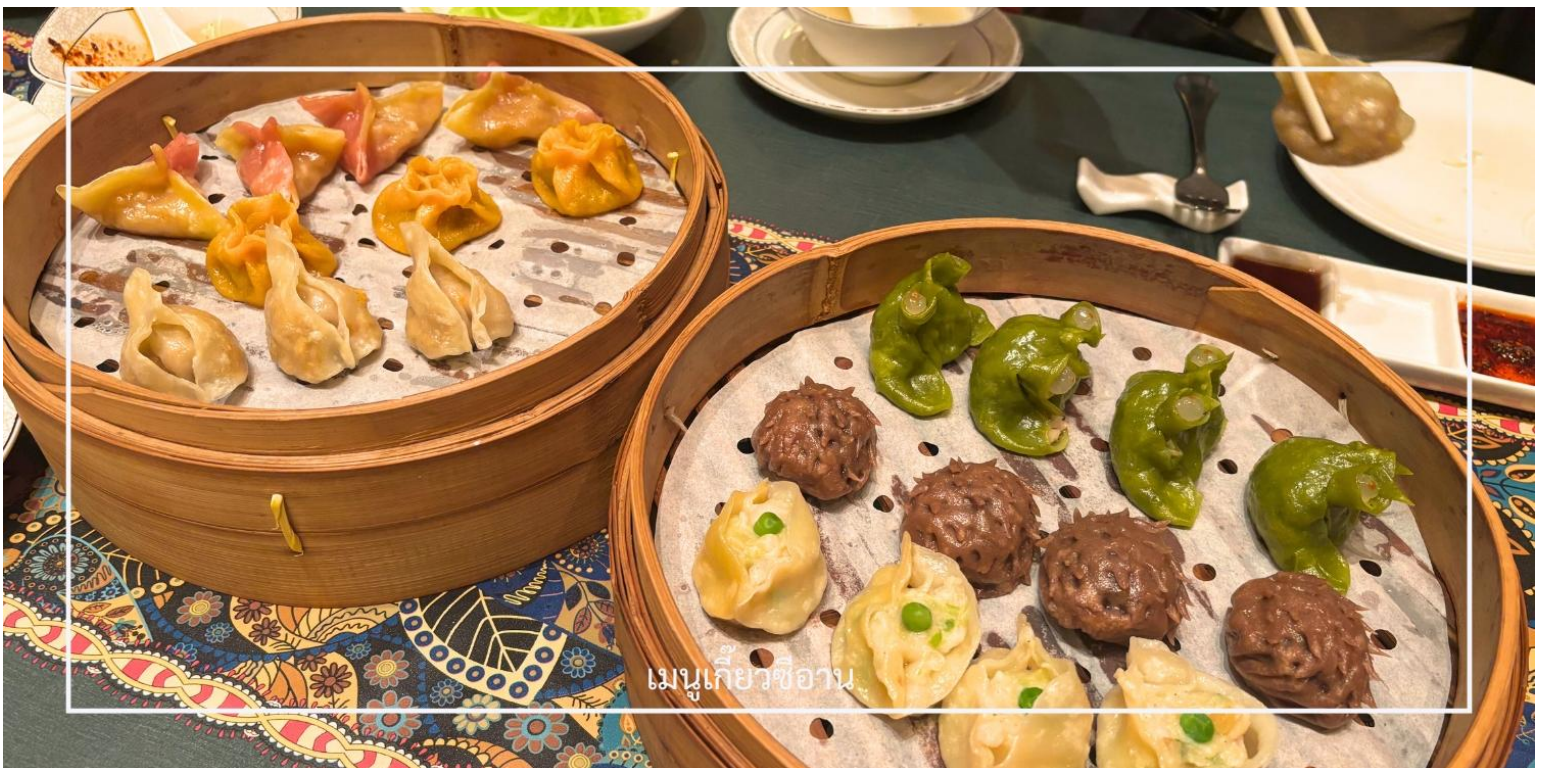
เมนูเกี้ยวซีอาน

พร้อมทั้งลิ้มรสเกี้ยวซีอาน อาหารท้องถิ่นชื่อดัง รสชาติจัดจ้านกลมกล่อม ซึ่งเป็นประสบการณ์ทางวัฒนธรรมและรสชาติที่ควรลิ้มลองสักครั้ง