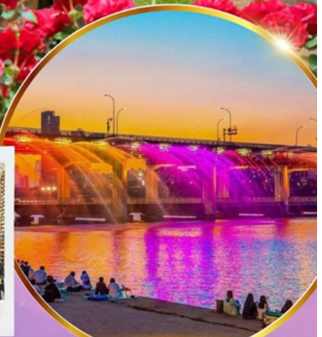
ชมสะพานน้ำพุสายรุ้ง