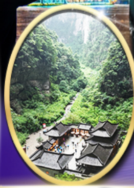
อุทยานหลุมฟ้า สะพาน สวรรค์