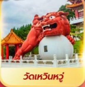
วัดเหวินหฺวู่