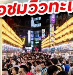
ไถจงไนท์มาร์เก็ต