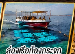
ล่องเรือท้องกระจก