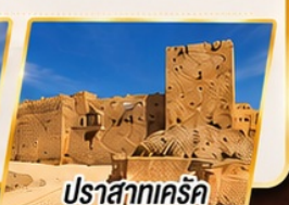
ปราสาทแคร็ก