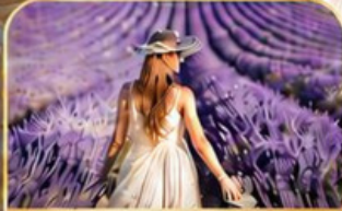
ทุ่งดอกลาเวนเดอร์