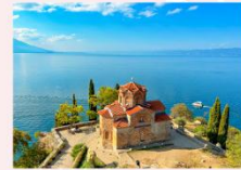
St. John at Kaneo Church ป้อมปราการซามูเอล