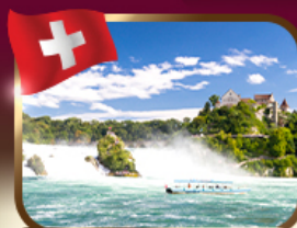
ชมน้ำตกโรนที่ใหญ่ที่สุดในยุโรป