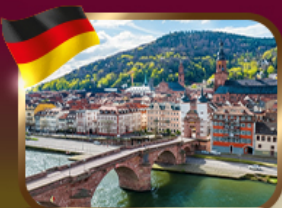
เมืองโรแมนติกไฮเดลเบิร์ก