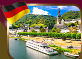
ล่องเรือ นือบบาร์ด - ชิงกอร์