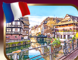
เที่ยวแคว้นอัลซาส สตราสบูร์ก