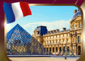
เขาคอนพิงก์กันท์ลูฟร์ ปารีส