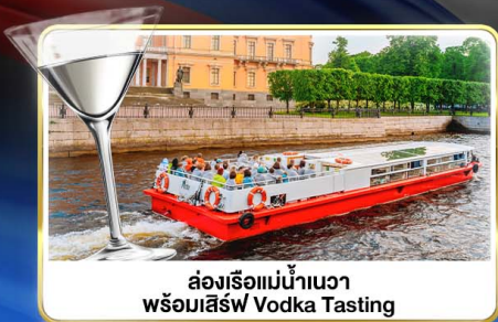
ส่องเรือแม่น้ำนาวา พร้อมเสิร์ฟ Vodka Tasting

📅 เดินทาง : 14-21 มิ.ย.69 / 28 มิ.ย.-05 ก.ค.69 / 24-31 ก.ค.69