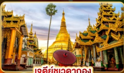
เจดีย์เขาดากอง

INLE 1 ปีมีครั้งเดียว ล่องเรือชมเมืองในสายน้ำ "ทะเลสาบอินเล" ชมประเพณีแห่พระบัวเข็ม