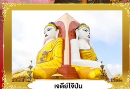
เจดีย์ไข่มุก