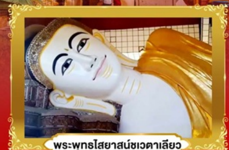
พระพุทธรูปไสยาสน์ชเวดาคะเลียว